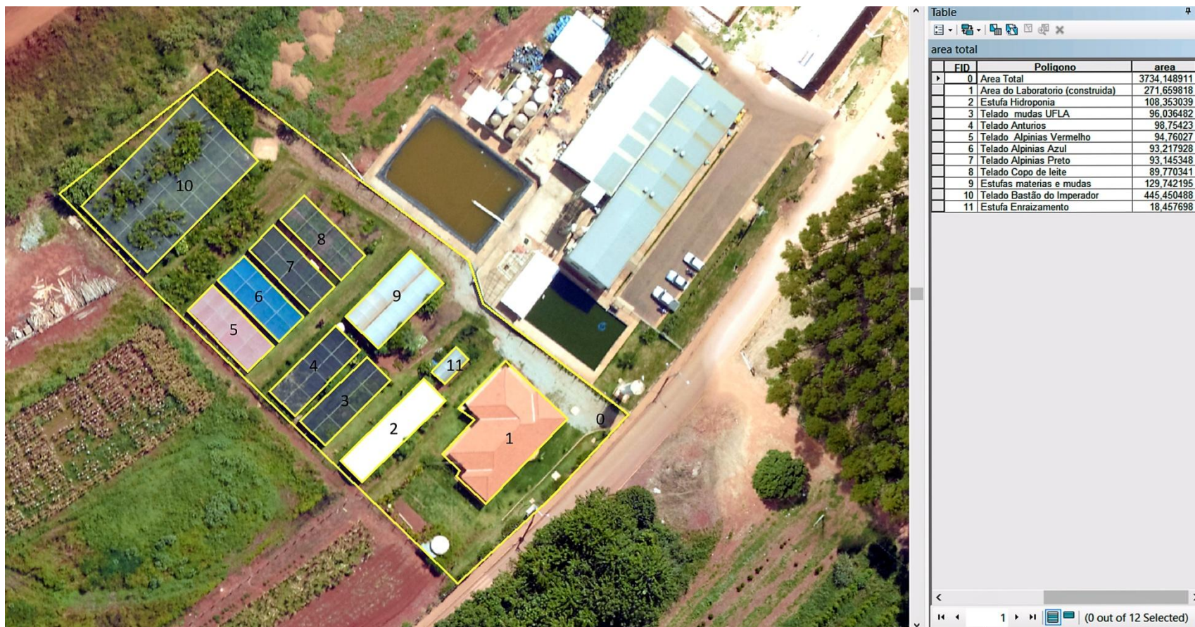
Imagem Aérea - Setor de Floricultura e Paisagismo do Departamento do Agricultura local no qual será executado os serviços relacionados nos itens 4, 5, 6, 7, 8, 9, 10, 11, 12, 13 e 14 que compõem o grupo 2 no Anexo II do Edital do Pregão Eletrônico nº 24/2017.